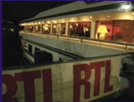
Les couleurs de RTL parent le Rhône Princess