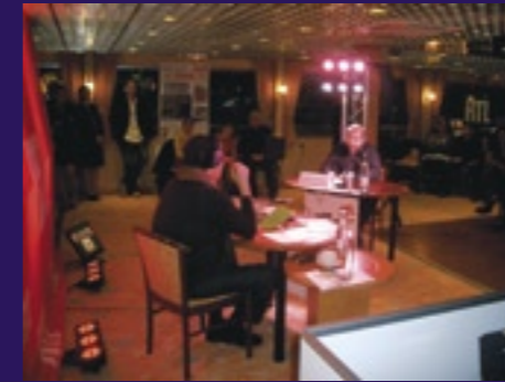
Moment de concentration extrême en attendant la réponse