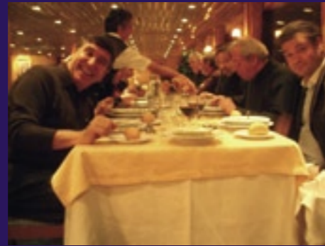
Un dîner amical en prélude à cette soirée exceptionnelle