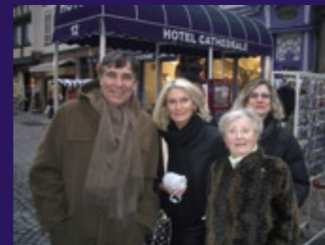
Souvenir de la découverte du marché de Noël de la Cathédrale