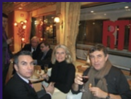
Après l'effort le réconfort