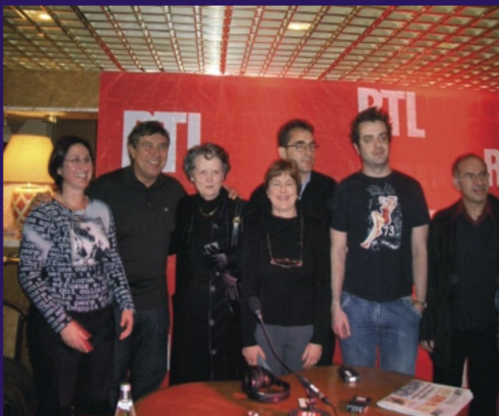
Les heureux gagnants qui ont osé doubler !