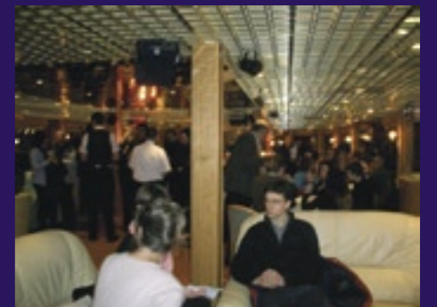
Causerie lors du cocktail