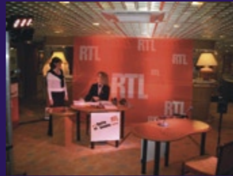
Derniers réglages avec la technique