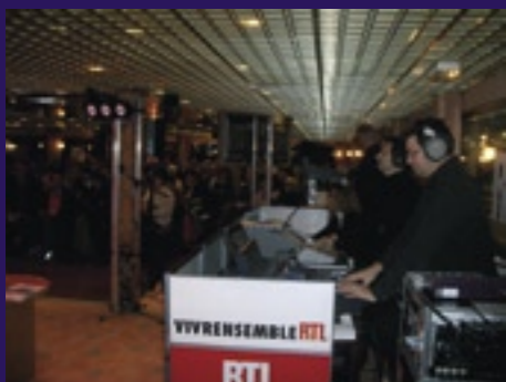
Une impressionnante régie règle et rythme le tempo du jeu